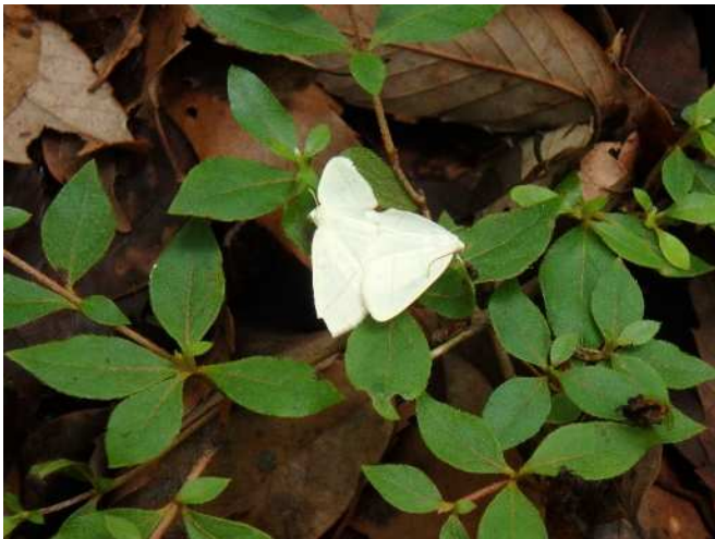
交尾をするガの仲間