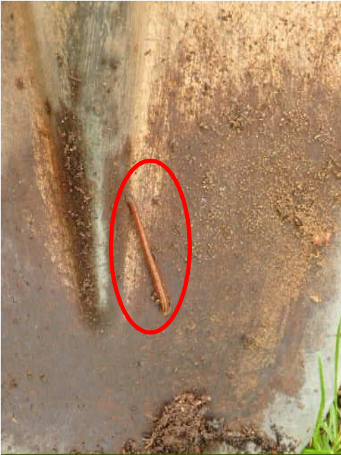
スコップを伝って登ってくるヤマビル

●ヤマビルの活動が活発になる時期です。登山靴の周りにムラなく虫よけスプレーなどをかけておくと効果あります。パークレンジャーは登山道のメンテナンスのため、巡視の時にはスコップを持ち歩いています。スコップを伝ってヤマビルが登ってくることがよくあります。登山の時にストックを使われる方は、同じようなことが考えられるので、ストックにも虫よけスプレーをかけておくと良いでしょう。