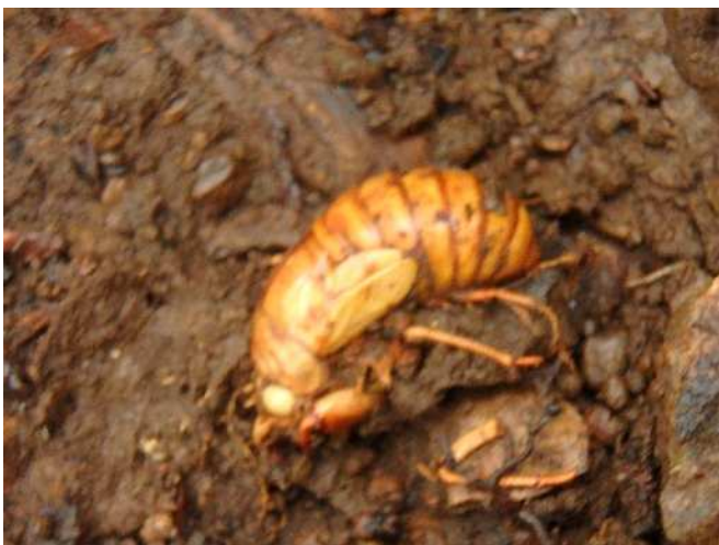
成虫になる前に亡くなったセミの幼虫