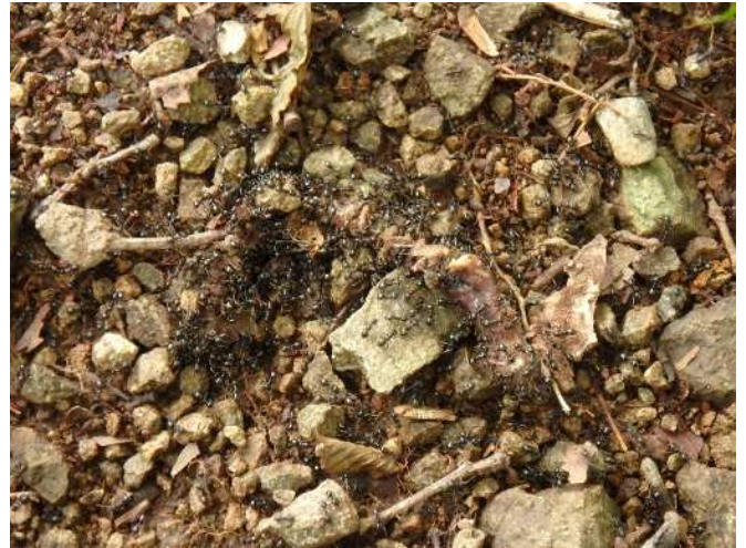
ミミズの死体に集まるアリ