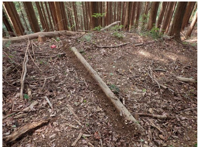
水切り工掘削作業の様子