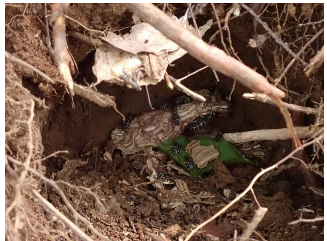
クロスズメバチの巣