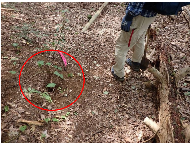
クロスズメバチの巣の位置