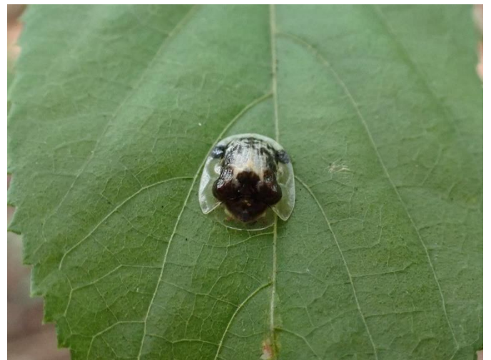
イチモンジカメノコハムシ 体の周辺部が半透明でユニークです。