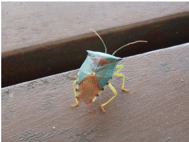
セアカツノカメムシ