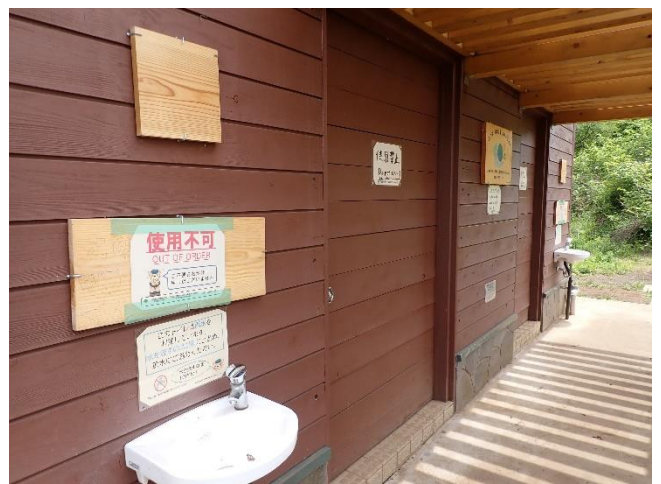
陣馬山山頂トイレ