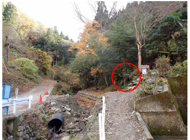
登山口（和田バス停から800メートル）