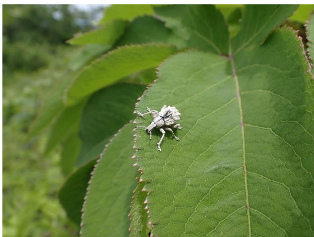
シロコブゾウムシ