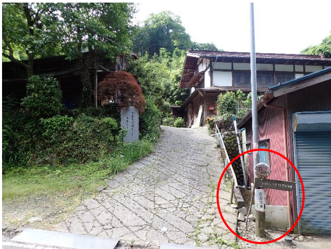
登山口（和田バス停から500メートル）