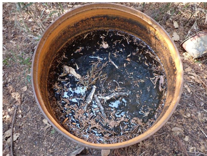
氷がはった防火用水