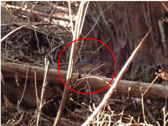
ルリビタキのオス