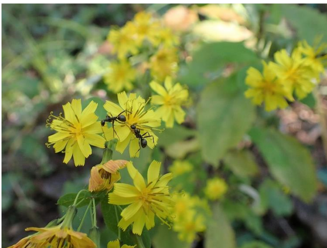
ヤクシソウ アリが蜜をなめていました。