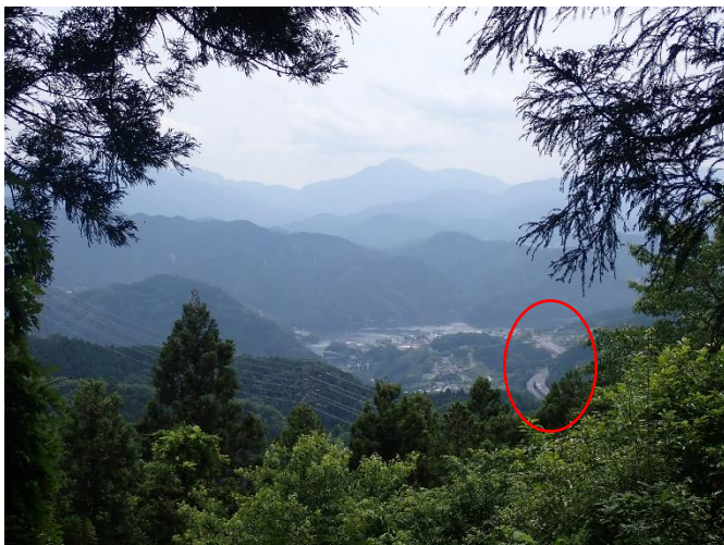
山間に見える中央道