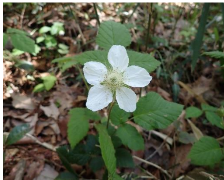
クサイイチゴ 背丈が低くて草のよう