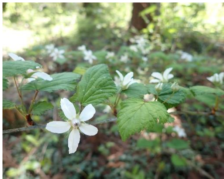
ニガイイチゴ 花は細く、上向きにつく