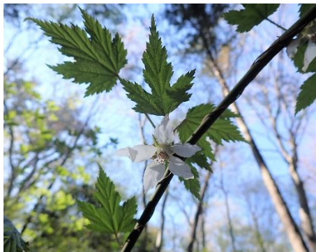
モミジイチゴ 葉の形がモミジのよう