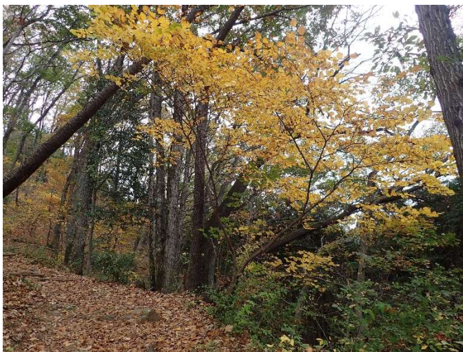
ダンコウバイの黄葉