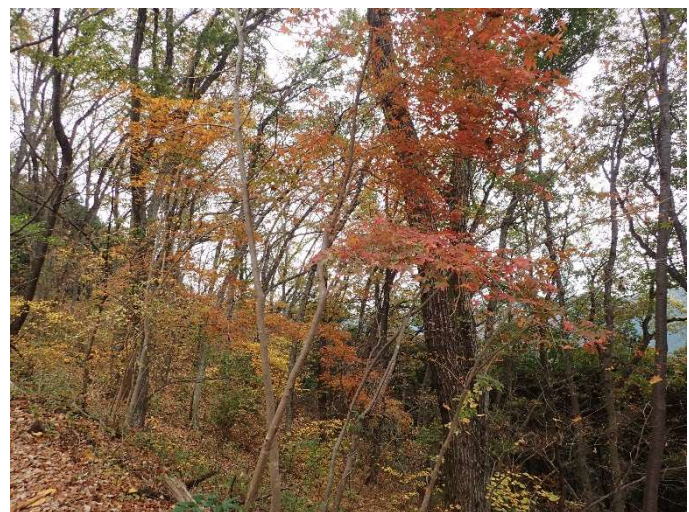
カエデの仲間の紅葉