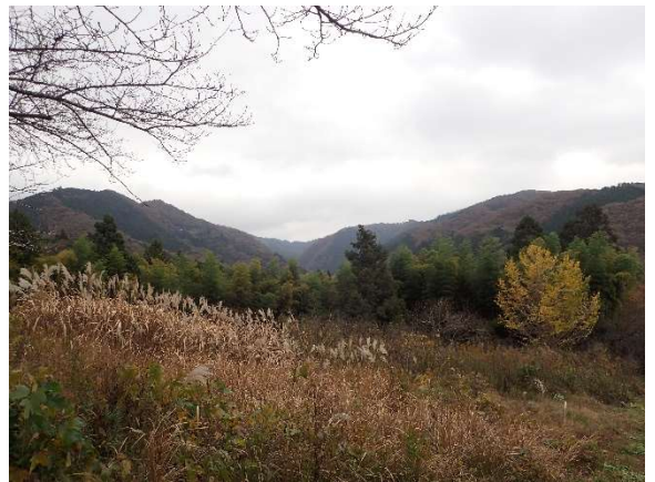
写真右がイチョウの木

糞の中には銀杏のような種がありました。 そういえば、山道に入る前に黄葉したイチョウの木を見かけました。 里の恵みも利用しながら来たる冬に備えているのですね。