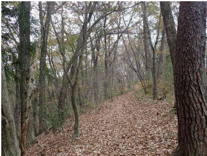
落ち葉の積もる登山道

● 落ち葉をよく見ると、見覚えのある形の葉が。柏餅に使われるカシワの葉です。陣馬山周辺ではカシワ林を見ることが出来ます。