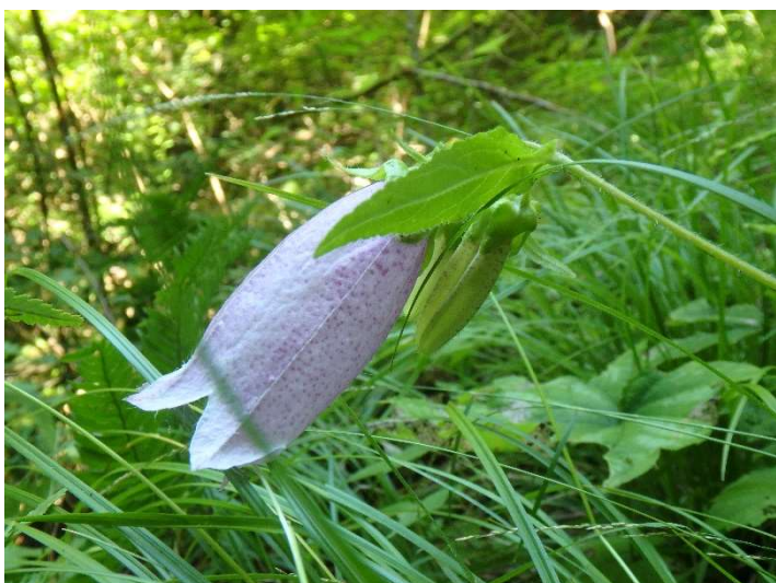
ヤマホタルブクロ