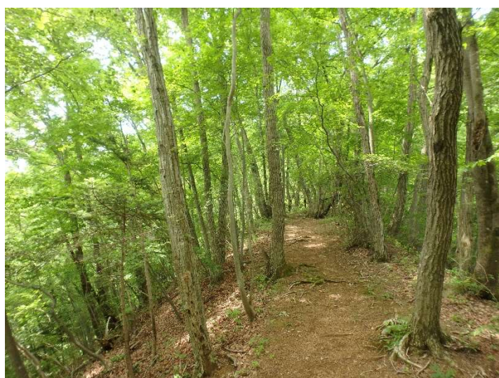
山頂付近の雑木林