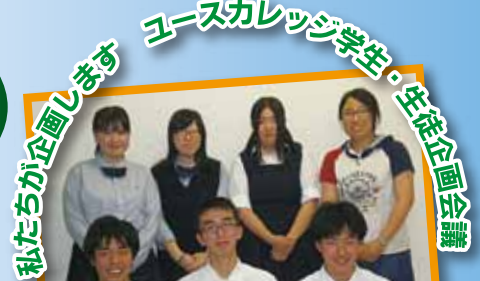
私たちが企画します

安全・安心まちづくりに若い力を! を合言葉に、神奈川県内で防犯ボランティア 活動を展開(これから展開しようとする) 高校生・大学生達が集まる研修会です。