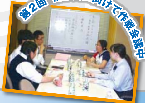
第2回 研修会に向けて作戦会議中

学生・生徒による企画 第1弾! (第2回 研修会) 8月18日(月) 横浜市開港記念会館