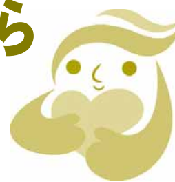
犯罪被害者等支援シンボルマーク「ギョっとちゃん」

犯罪被害者等が、犯罪等により受けた被害から立ち直り、再び平穏に過ごすためには、地域のすべてのの方々の理解と配慮、そして協力が重要です。