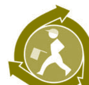
神奈川交通安全シンボルマーク

飲酒運転の根絶 歩行者(特に高齢者)と自転車の交通事故防止 全ての座席のシートベルトとチャイルドシートの正しい着用