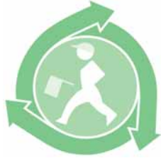
交通安全シンボルマーク