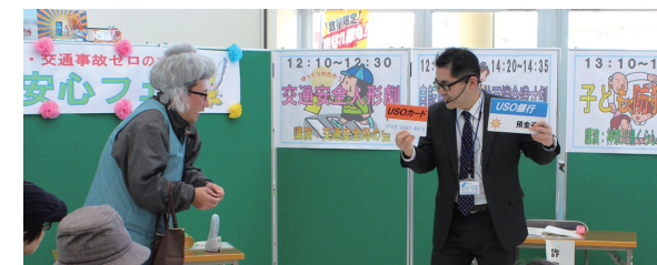
写真は振り込め詐欺防止寸劇の様子(右 犯人役、左 被害者役)。

○子ども防犯教室:着ぐるみを使った誘拐防止教室(対象は園児~小学2年生) / ○一般防犯教室:寸劇を交えた振り込め詐欺、ひったくり防止など(対象は一般、高齢者) / ○薬物乱用防止教室:飲酒、喫煙、薬物乱用の防止(対象は小学校高学年~大学生)