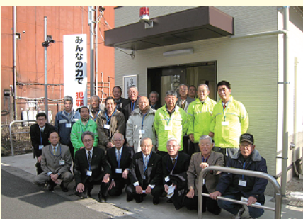
『さがみはら安全・安心ステーション』