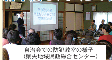
自治会での防犯教室の様子 (県央地域県政総合センター)