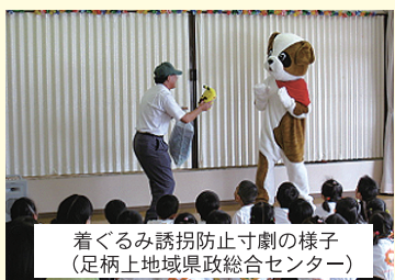
着ぐるみ誘拐防止寸劇の様子 (足柄上地域県政総合センター)