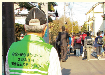
子ども見守り活動の様子