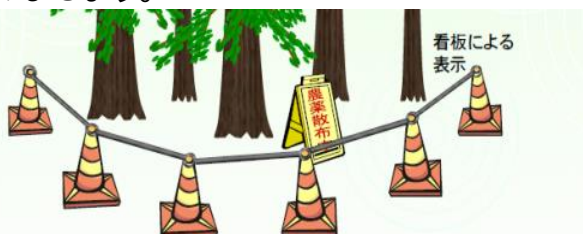
散布区域をコーン等で区分け