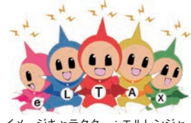
イメージキャラクター：エルレンジャー