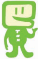
国税庁e-Taxキャラクター イータ君

1 税務署に出向くことなく、インターネットを利用して申告、申請・届出、納付などの手続きができます。