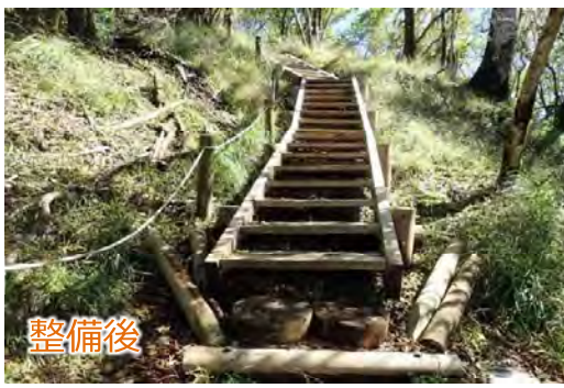
登山道整備・補修