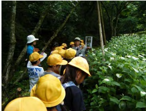
自然観察を通じた普及啓発