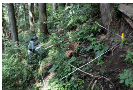
生物多様性機能調査（植物）