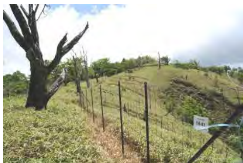
大規模ギャップの再生事業検証

丹沢大山自然再生計画の特定課題である「ブナ林の再生」について、ブナ林衰退機構に関する研究成果を踏まえ、効果的な再生対策を展開するため「ブナ林再生指針」を取りまとめ、指針を受けて実施しているブナ林再生事業の効果検証に取り組んでいます。