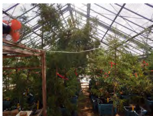
無花粉スギ閉鎖系採種園