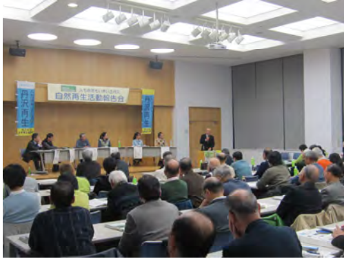
丹沢大山自然再生委員会との連携