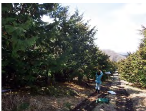
ヒノキの人工交配