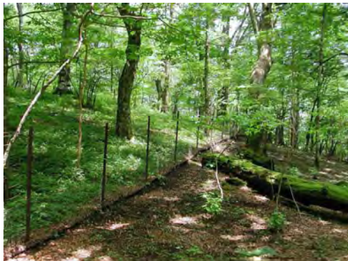
植生保護柵の設置