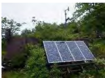
大気・気象モニタリング調査