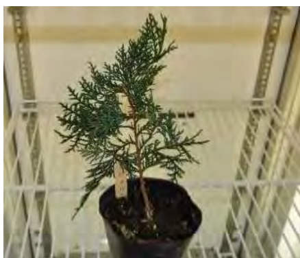
無花粉ヒノキの特性解明

「神奈川県花粉発生源対策10か年計画」への対応として、これまでの研究成果を踏まえ、無花粉スギ・ヒノキの苗木生産の効率化、また雄花着花量調査等に引き続き取り組んでいます。