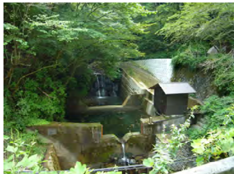
水源かん養機能調査

かながわ水源環境保全・再生実行5か年計画に基づき、水源の森林づくり事業等の施策の効果をわかりやすく説明するため、また施策を柔軟に推進するために、水源かん養機能評価と生物多様性機能評価にかかるモニタリング調査に取り組んでいます。