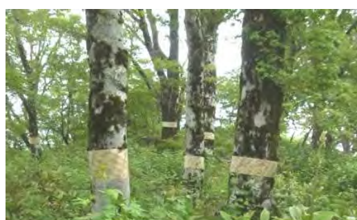
ブナハバチ被害防除試験