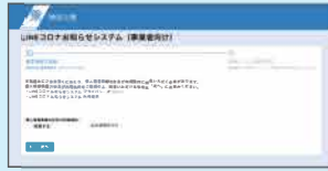
LINEコロナお知らせシステム 登録フォーム