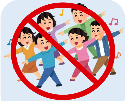
不可有多数人的聚集