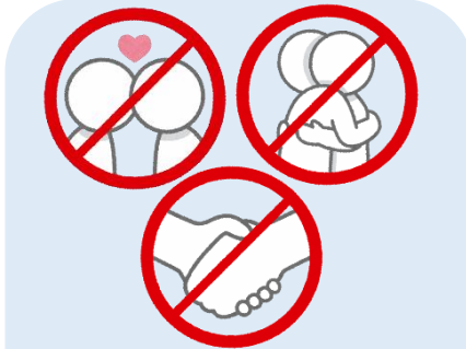
因为亲吻、拥抱和握手等是高风险的感染行为，须警戒注意