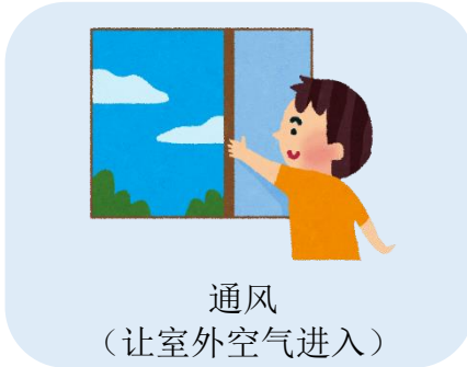
通风 (让室外空气进入)