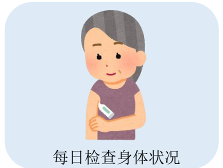
每日检查身体状况