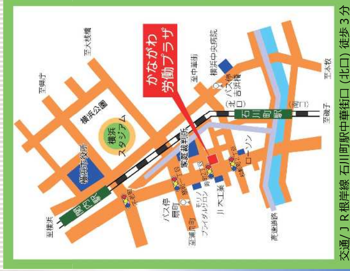
交通/J R 根岸線 石川町駅中華街口(北口) 徒歩 3分

指定管理者 公益財団法人 神奈川県労働福祉協会 TEL:045-633-5410 (代)