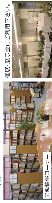
労働情報コーナー