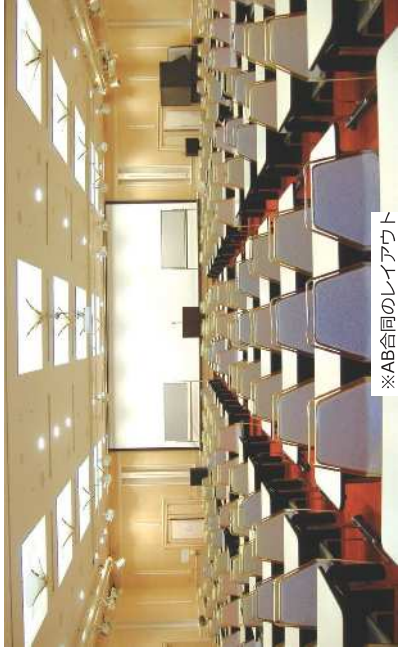
※AB合同のレイアウト

講演会、講習会、シンポジウム、セミナー、会議、研修、試験会場、懇親会やバーテイー、各種イベントの他、健康診断など多彩なレイアウトで、多目的にご利用頂けます。