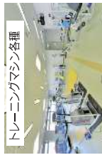
トレーニングマシン各種

小規模会議・研修・打合せなどに適しています。また、間仕切りを外し、2室同時の利用も可能です。(Wi-Fi完備：無料)