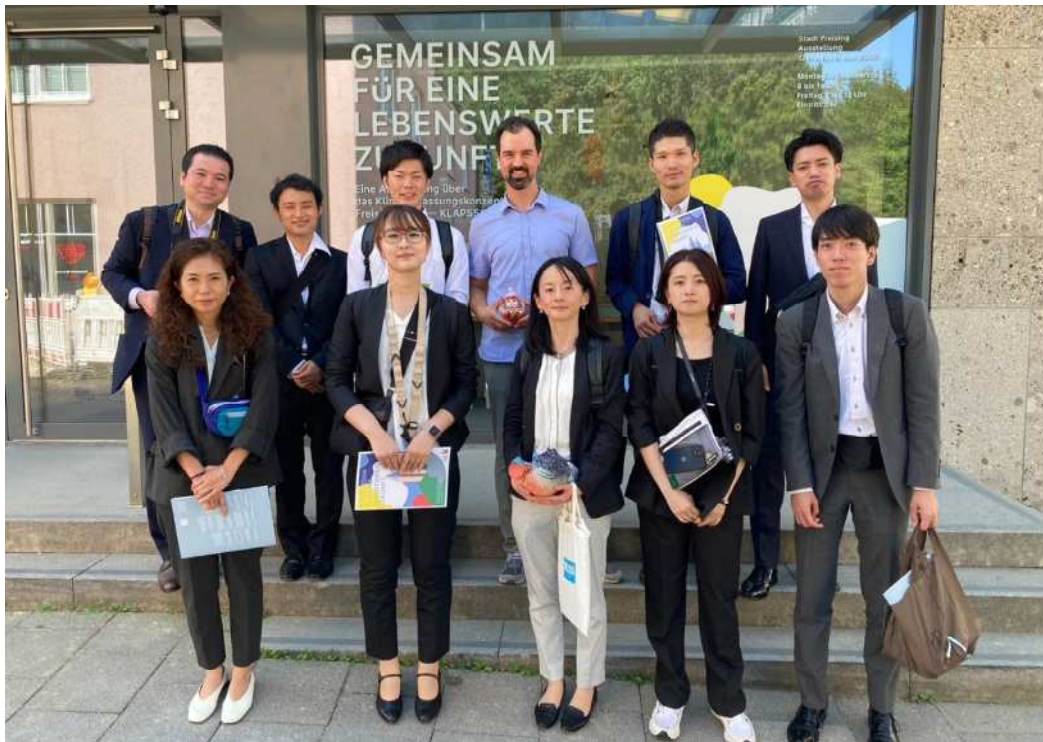
第27回神奈川県商業従業者海外派遣団（ドイツ・Stadt Freisingにて）