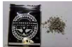
危険ドラッグ 【お香・アロマ・バスソルト】