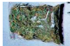
大麻 【マリファナ・チョコ・ハツパ】