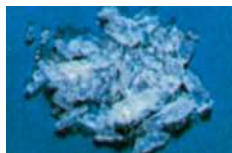
覚醒剤 【エス・スピード・シャブ】