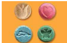
MDMA 【エクスタシー・パツ】