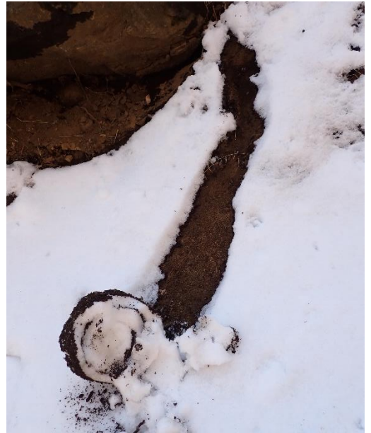
ゆきまくり 雪のロールケーキの様