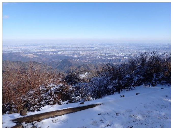
大山山頂公衆トイレ前

山頂の公衆トイレは凍結のため、男女合わせて使用できるトイレが一ヶ所のみとなっていました。混雑する可能性もあるため、出来るだけ麓でトイレを済ませる等、ご協力をお願いします。