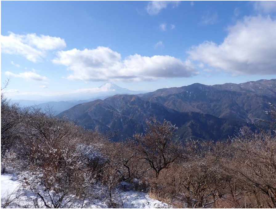
大山山頂から見る丹沢の山並みと富士山