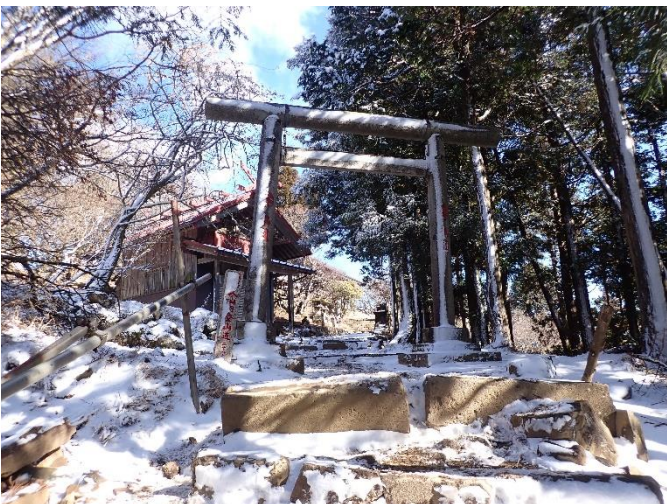
大山山頂 鳥居付近