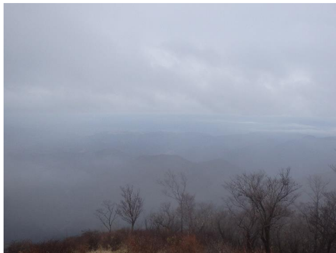
小丸分岐からの眺め