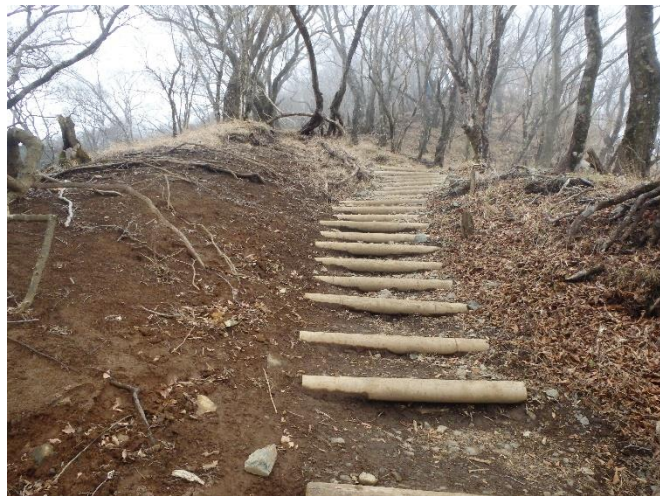
鍋割山稜の丸太階段