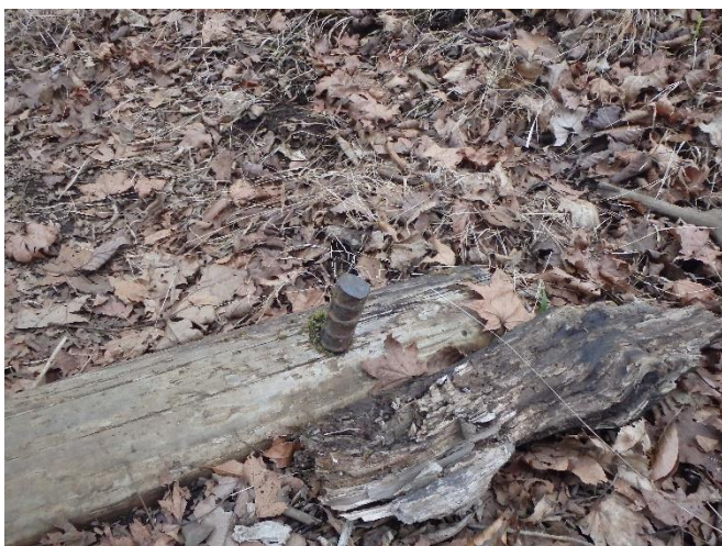
鉄杭の打ち込み作業前