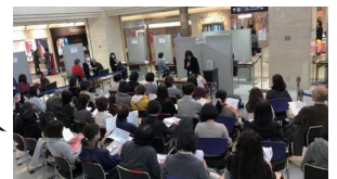
好評だったこれまでの様子

子どもを育てながら、仕事を探しています。 キャリア・カフェに参加したことで、 自信が持てるようになりました。