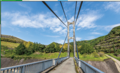
4 松ヶ山橋 ダムを正面に見ることができます。