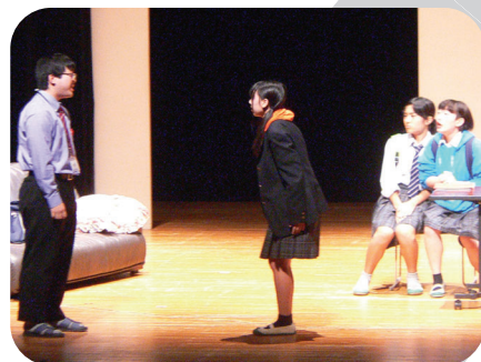
神奈川県立青少年センター 紅葉坂ホール