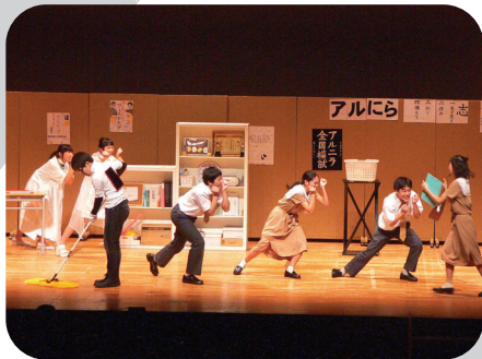
麻布大学附属高等学校 「えーあい」