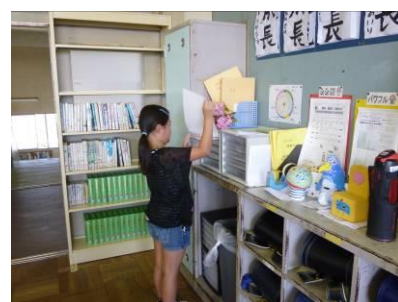
次のプリントを取りに行く

スキルタイムのあとの5時間目の授業では、全教員が一つのクラスに集合して研究授業です。