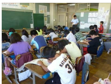
黙々と計算問題に取り組む

スキルタイム。全クラスで、週3回5時間目の始まる15分前に、計算、漢字の練習を取り入れています。採点は各自で行い、進み具合も各自のペースで。