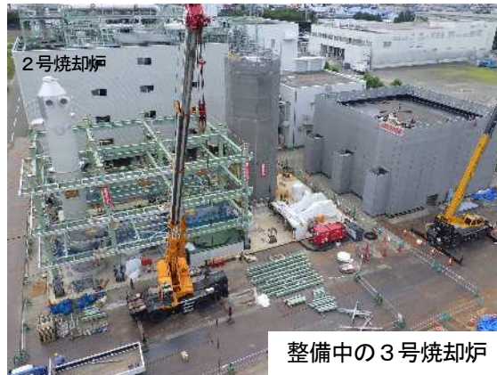
相模川流域下水道(右岸処理場) 汚泥焼却炉の整備