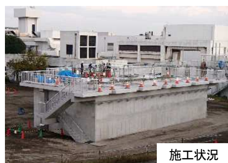
相模川流域下水道(左岸処理場) 第一分水槽耐震工事 (別位置へ施工)