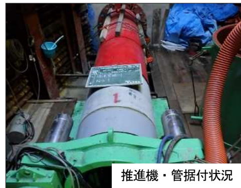
酒匂川流域下水道(箱根小田原幹線) 管渠築造工事(2-1工区)