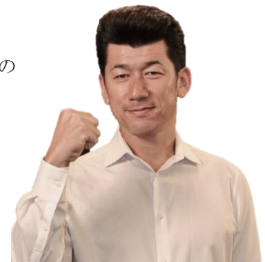
横浜 DeNA ベイスターズ

クイーンズスクエア横浜1階 イベントスペース「クイーンズサークル」 (横浜市西区みなとみらい2丁目3)