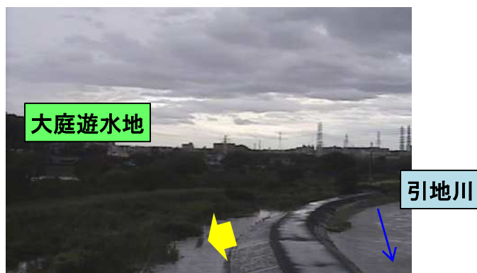
遊水地への流入状況(写真)