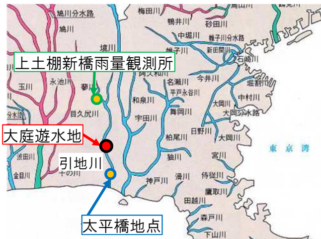
大庭遊水地 位置図