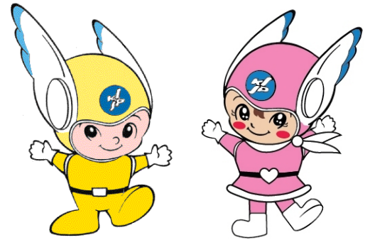
神奈川県警察シンボル・マスコット 「ピーガルくん」・「リリポちゃん」