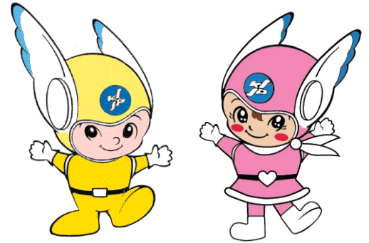
神奈川県警察シンボル・マスコット 「ピーガルくん」・「リリポちゃん」