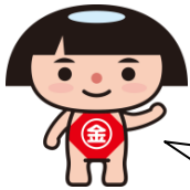
神奈川県PRキャラクター かながわキンタロウ

ボクと一緒にバリアフリーの街づくりを体験してみよう！ 今回は熊本から招待した講師のお話が聴ける貴重な機会があるよ！