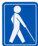
視覚障害のマーク