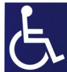
国際シンボルマーク