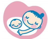
マタニティマーク