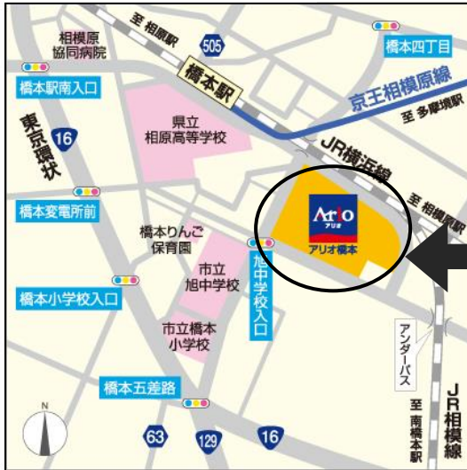
(アリオ橋本周辺図)