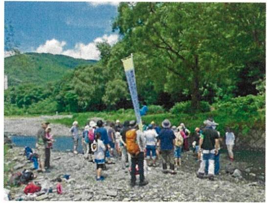
戸川砥石等の特徴説明を聞き 砥石等を探しています。

例年は水上ブランコや飛込など楽しい遊びが ありましたが、今年はそれらがなかったものの、 子供たちは水に入りビニール袋を引き、 流れの強さを体験したり笹舟作りなど、 元気いっぱいに楽しみました。