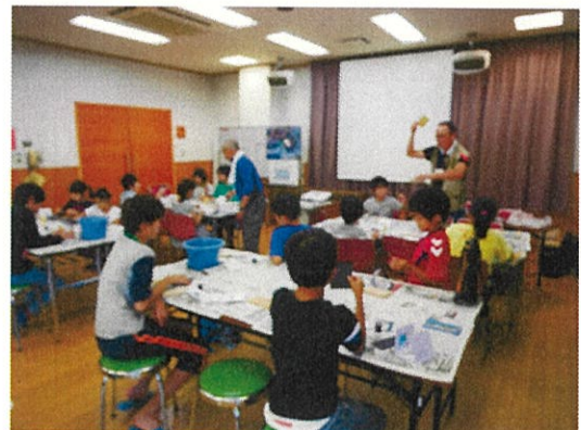
有孔虫の入った石灰岩削り実習