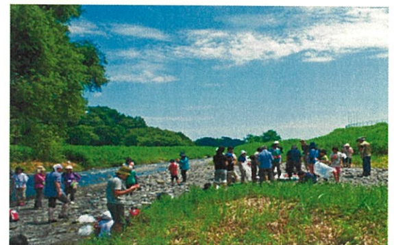
みんなでスイカを食べました