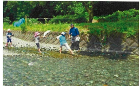
水流を止めるため三人で引きました