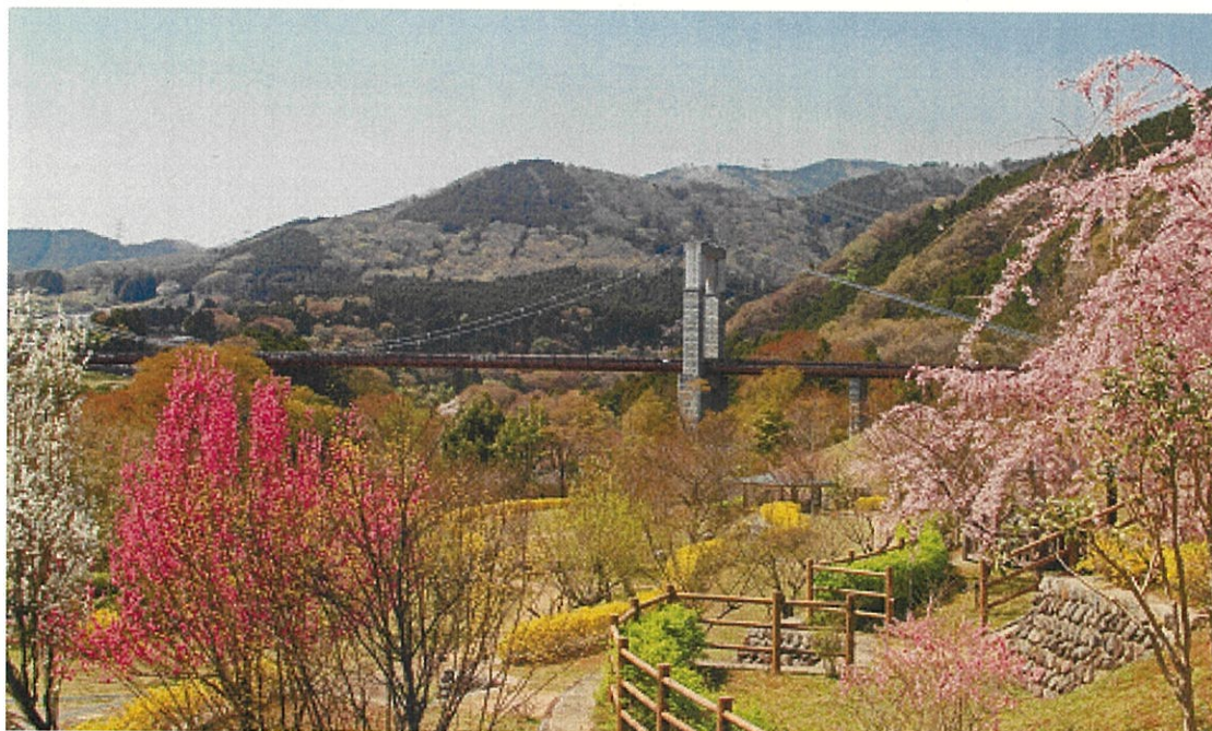
水無川上流・戸川公園（風の吊り橋と表丹沢）