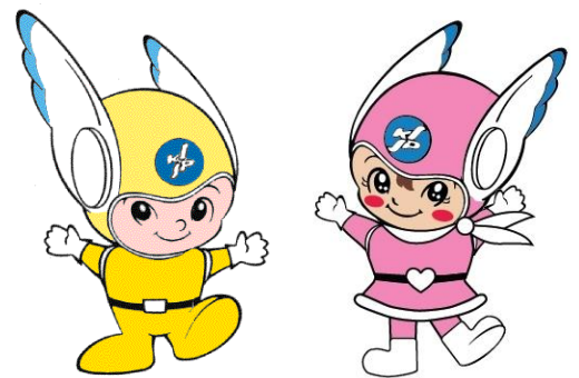
神奈川県警察シンボル・マスコット 「ピーガルくん」・「リリポちゃん」