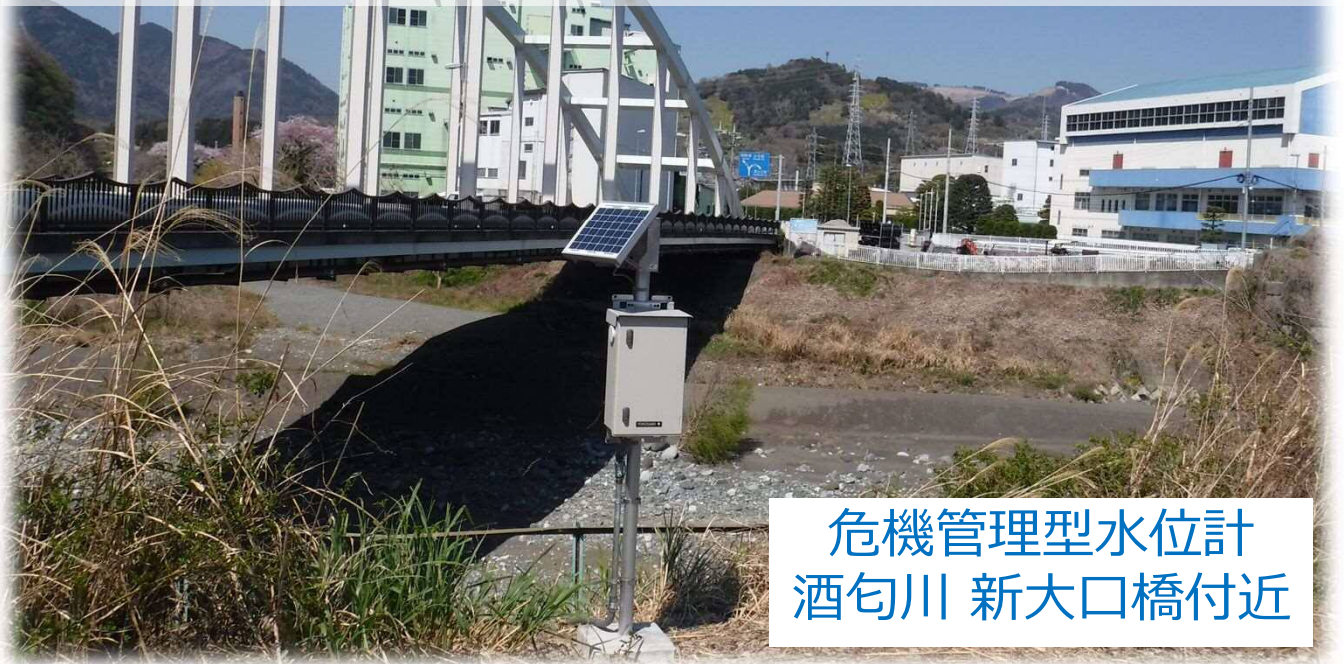
危機管理型水位計 酒匂川 新大口橋付近