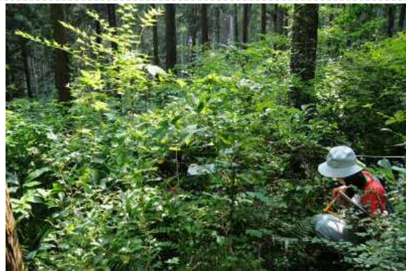
森林生態系効果把握調査の状況（小田原市久野箱根外輪山の整備後5年が経過したヒノキ林）