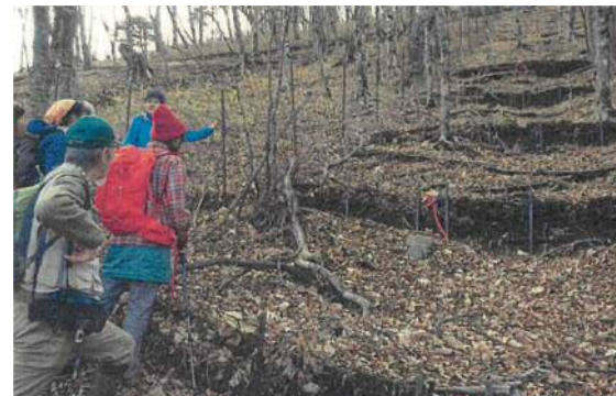
丹沢大山の保全・再生対策（清川村宮ヶ瀬）