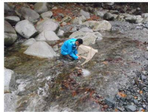
河川の流域における動植物等調査の様子（玄倉川 ユーシンロッジ前）