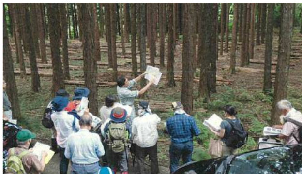
水源の森林づくり事業の推進（厚木市七沢）