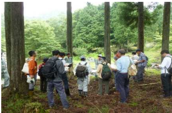
溪畔林整備事業（山北町）