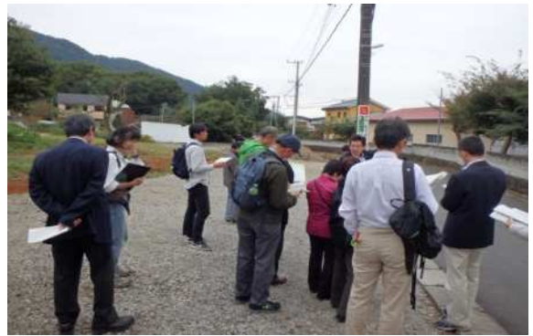
県内ダム集水域における公共下水道の整備促進 （相模原市緑区）