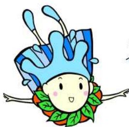
水源環境保全・再生 イメージキャラクター しずくちゃん