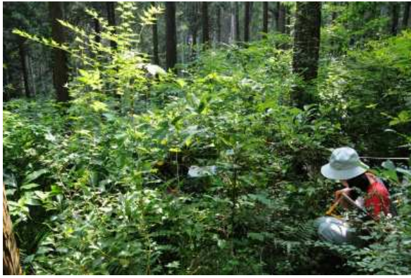
森林生態系効果把握調査の状況（小田原市久野） 箱根外輪山の整備後5年が経過したヒノキ林