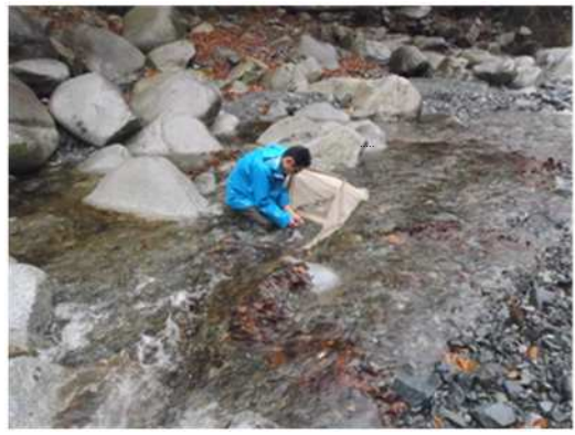
河川の流域における動植物等調査の様子 （玄倉川 ユーシンロッヂ前）