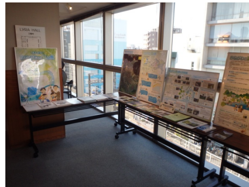
パネル展示・資料配架