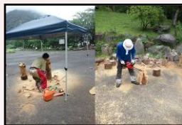
間伐材を活用した製品の製作