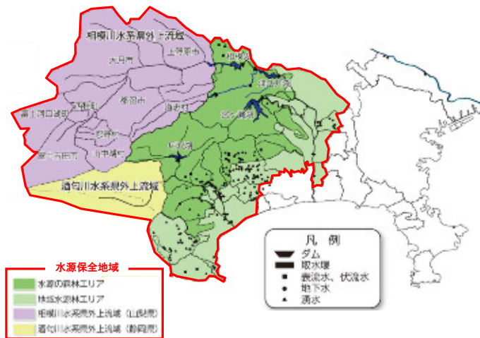
【水源環境保全・再生施策の主たる対策地域】