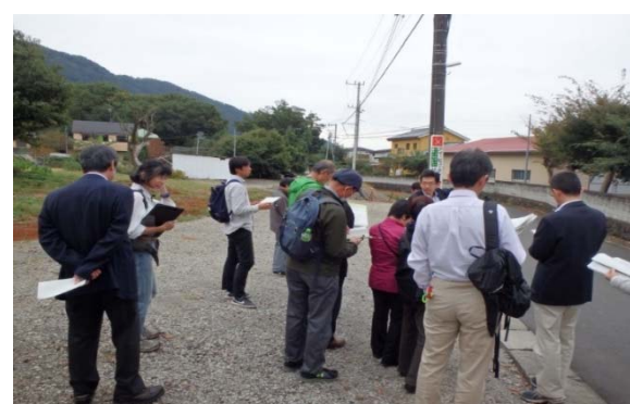
県内ダム集水域における公共下水道の整備促進 （相模原市緑区）