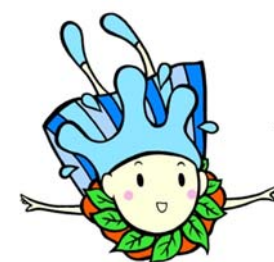
水源環境保全・再生 イメージキャラクター しずくちゃん