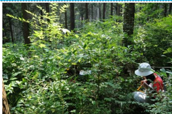
森林生態系効果把握調査の状況（小田原市久野） 箱根外輪山の整備後5年が経過したヒノキ林