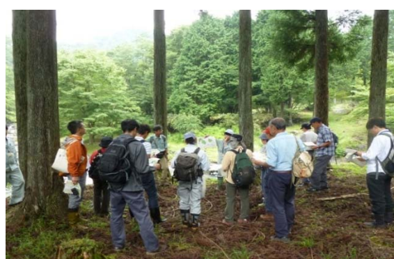
溪畔林整備事業（山北町）