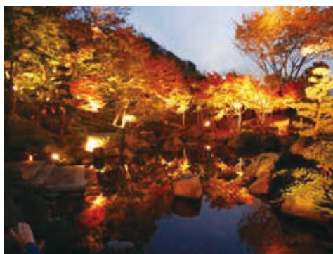
秋にはライトアップされるもみじ