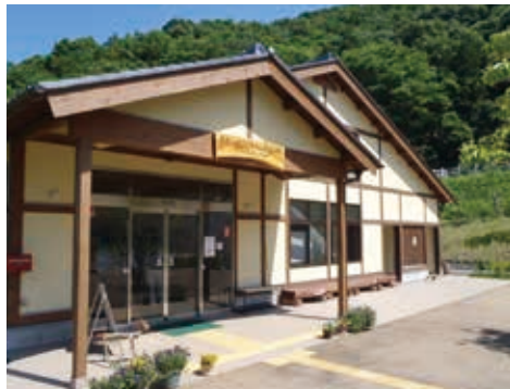
各種教室も開かれるパークセンター