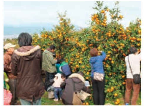
みかんの収穫体験ができるふるさと果樹園