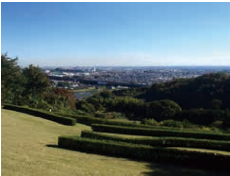
展望広場から眺める伊勢原市街