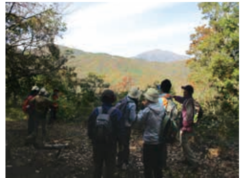
塔の山山頂から見る大山