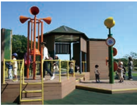
子連れの多い遊具コーナー