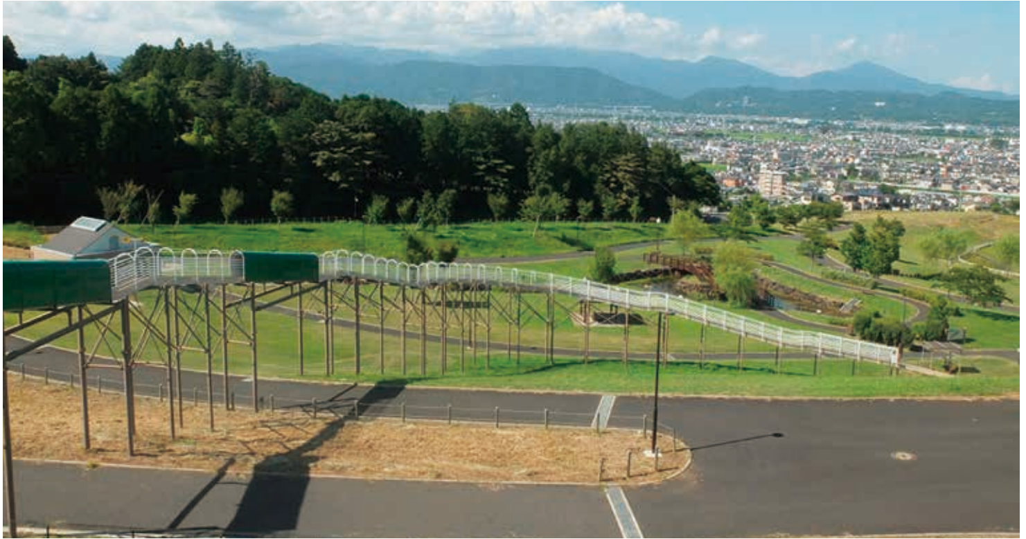
全長169mのローラーすべり台

小田原市の北西部に位置する「ふるさとふれあい公園」をテーマとした公園です。園内には太陽光発電や屋上緑化を取り入れた環境共生型パークセンターや、全長169mのローラーすべり台、風や光を感じられる遊具、展望広場などがあります。隣接する「小田原フラワーガーデン」と一体となって、多くの人に親しまれています。