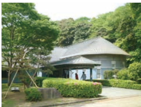
大磯町郷土資料館