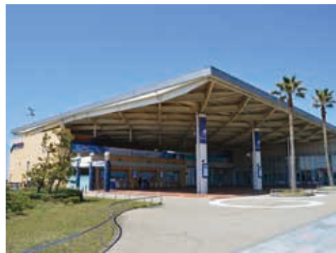
PFIで整備された新江ノ島水族館