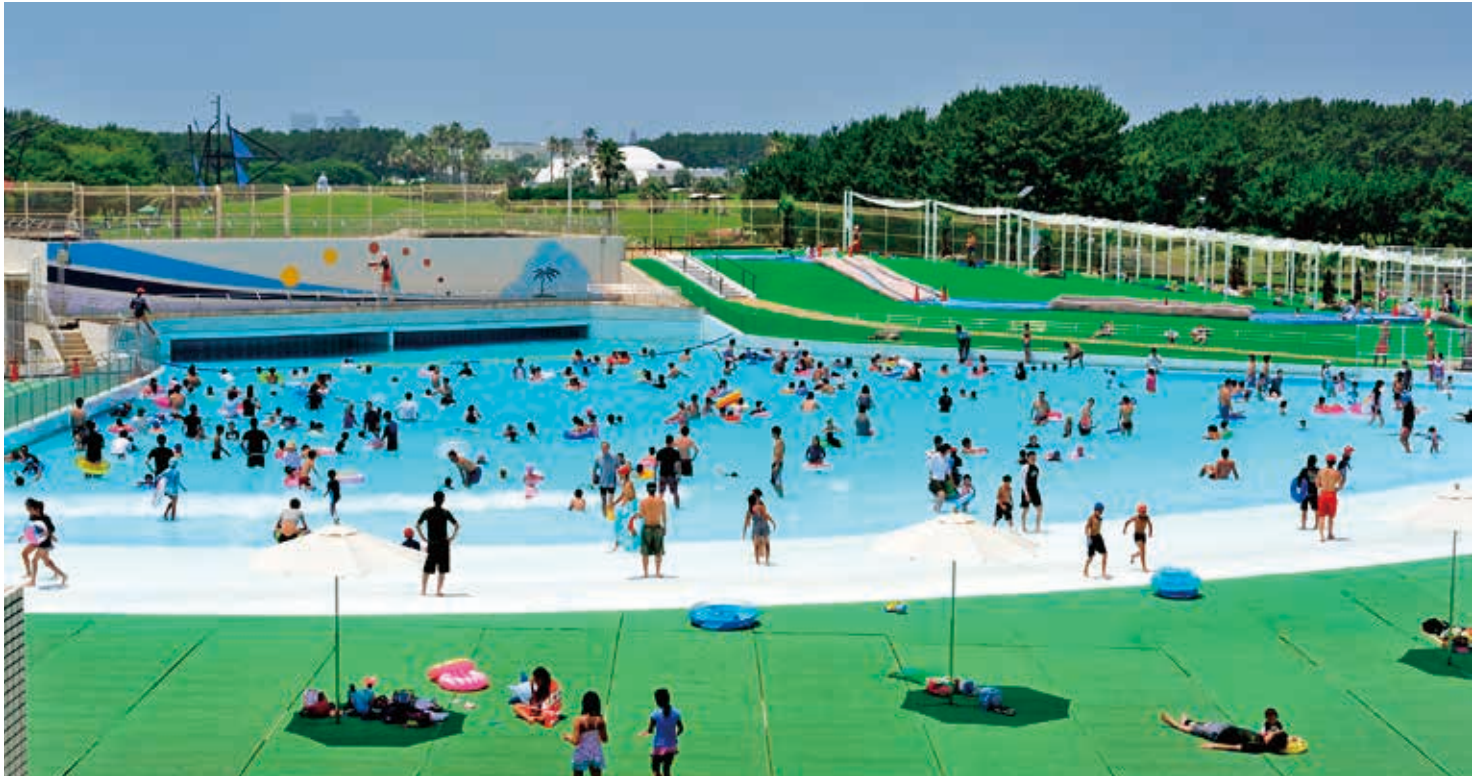
波の出るプールや流れるプールなど、大小6つのプールを持つジャンボプール

藤沢市の南西で海に接し、広々とした芝生を持つ公園です。海軍や駐留軍に接収されていた土地に1960年代から公園を整備しました。園内には交通公園やジャンボプールなど様々な施設があります。「しょうなんの森」という遊歩道が、トンネル化した国道の上部を通り太平洋へと続いています。