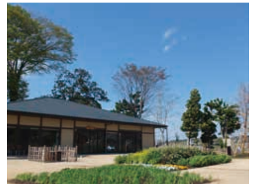
農と食を楽しむ地域交流拠点 里の家