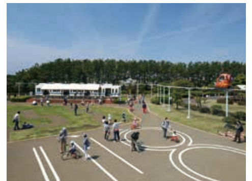
色々な乗り物を体験できる交通公園