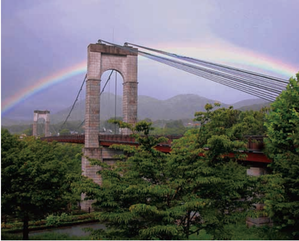
公園のシンボルである風の吊り橋

丹沢の裾野、秦野市西部に位置する山麓の樹林と水無川の自然を活かした大きな公園です。1990年代に広域的なレクリエーション活動拠点として計画され、約36ヘクタールが完成しています。園内にはビジターセンターや山岳スポーツセンター、バーベキュー場、茶室、子どもの広場などがあり、家族で一日楽しめる場となっています。2010年に第61回全国植樹祭の記念式典が行われました。