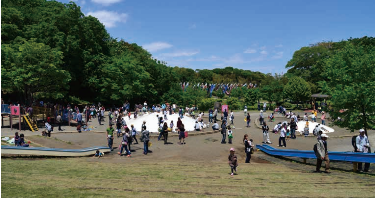
子ども達の歓声が響く風の広場

茅ヶ崎市北部に位置する里山の風景を残しながらつくられた公園です。公園中央にある柳谷 やなぎやと では田んぼや畑など里山の景観を楽しむことができます。また、お祭りにも使われる芝生の多目的広場、大型遊具のある風の広場、丹沢の山並みを眺めながらできるバーベキュー場など様々な施設があり、多くの利用者に親しまれ、県民協働で公園づくりに取り組んでいます。