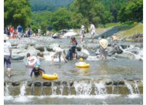
水無川での川遊び