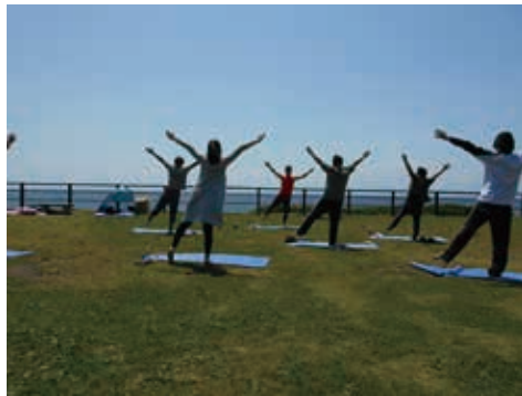
芝生広場を使ったビーチヨガ