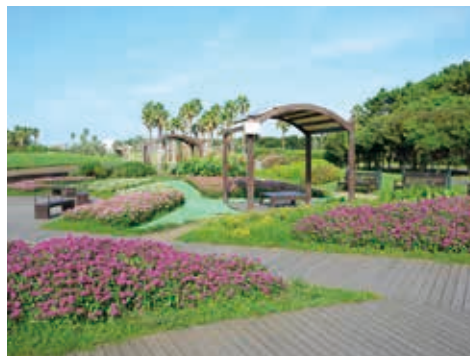
花景色が広がる花の庭