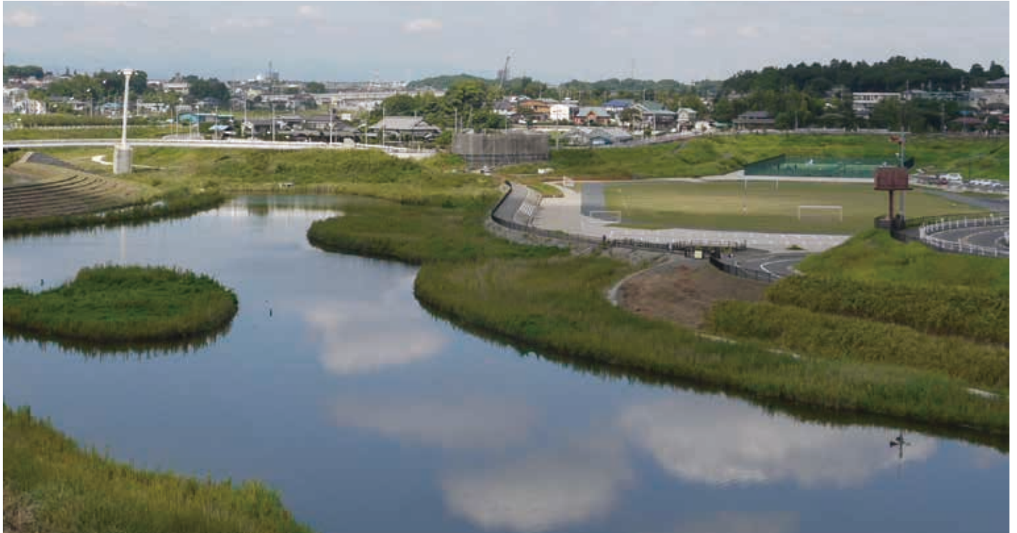
境川からあふれた水を貯水するビオトープ

横浜市と藤沢市の市境に位置する遊水地の上部空間を利用した公園です。平常時は運動施設やビオトープとして利用し、大雨が降ると一定の水位を超えた川の水を一時的に貯留し、洪水被害を軽減します。