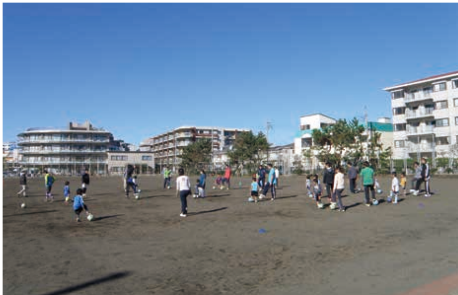
サッカー、ラグビーなど様々なスポーツができる運動広場