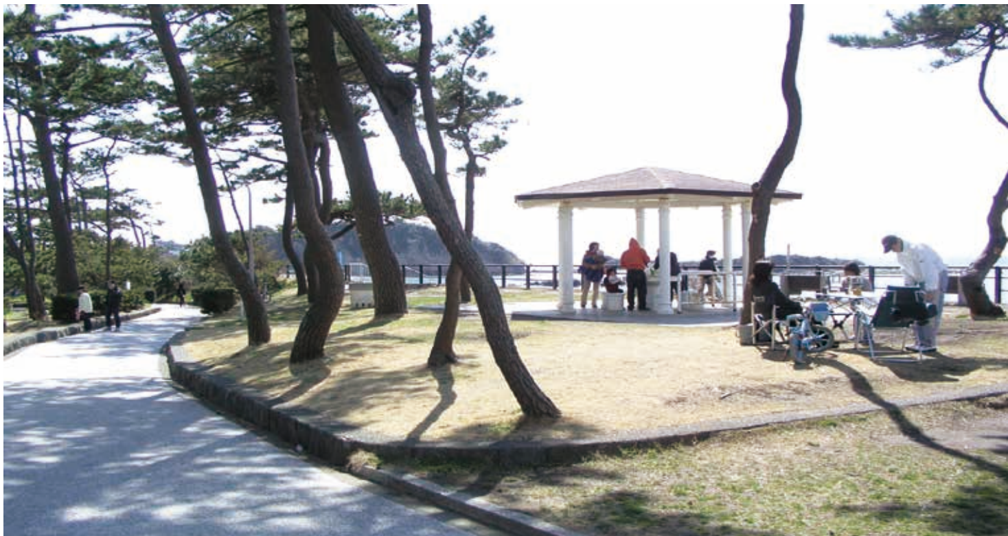
海に面した松林の小道

三浦半島のつけね西側に位置する葉山御用邸に隣接する小さな公園です。御用邸の馬場跡地を、その姿をあまり変えずに公園として整備しました。海水浴場に面しているため夏は賑やかですが、秋の訪れとともに相模湾の眺望に恵まれた静かな散策の地となります。