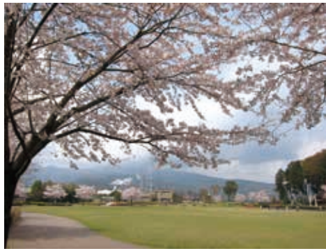
ピクニックに最適な多目的広場