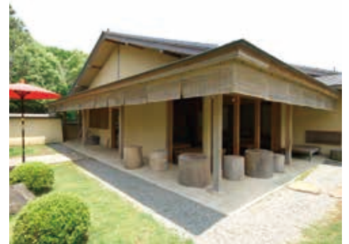
抹茶の提供もある茶室