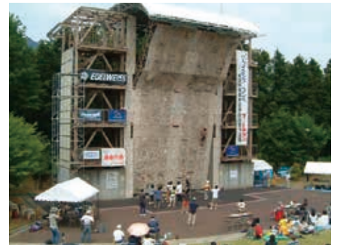
山岳スポーツセンター「クライミングウォール」