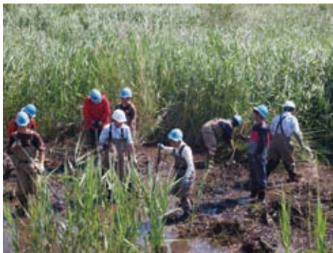
ボランティアによるビオトープ保全活動