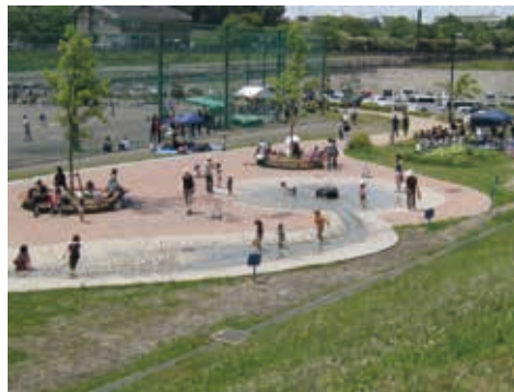
子どもに人気の噴水広場