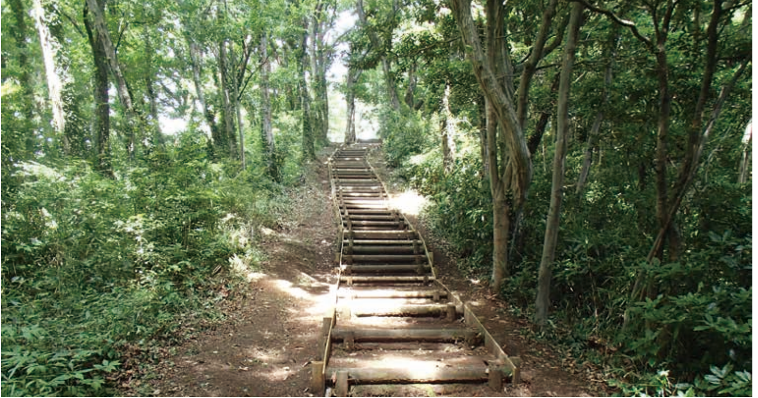
自然豊かな里山環境が残る園内

丹沢の麓、標高約203mの塔の山一帯の島状に残された里山の緑地を対象とした公園です。本公園は、土地所有者のご理解ご協力をいただき、公園部分について用地買収方式、緑地部分については市民緑地制度による借地方式を併用しているのが特徴です。