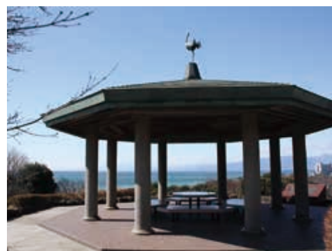
旧三井別邸地区の展望台から望む相模湾と伊豆半島