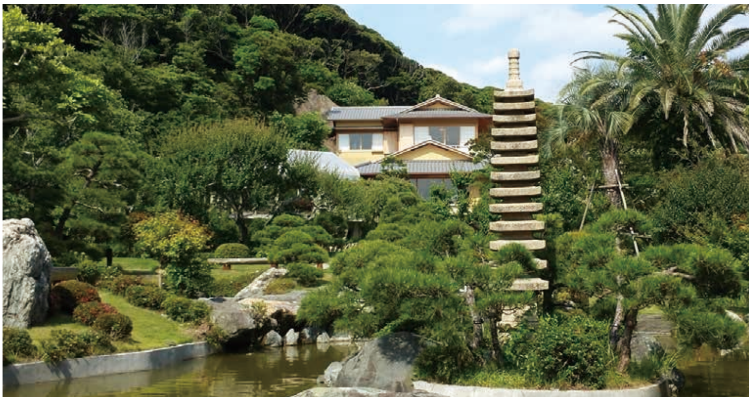
再建された旧吉田茂邸と日本庭園

湘南地域の西、大磯町の海辺に位置し、かつての別荘地の佇まいが感じられる公園です。1987年に開園した旧三井別邸地区には、日本情緒あふれる茶室や大磯町郷土資料館のほか、古墳時代の遺跡も残されています。また、2017年に全面開園した旧吉田茂邸地区には、モダニズムを加えた日本庭園と大磯町再建による旧吉田茂邸があります。