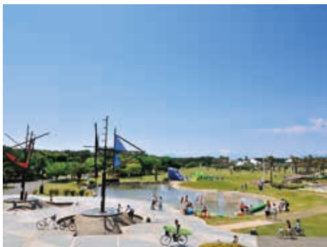
サザンセイルがシンボルの海の広場