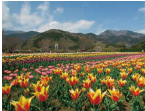
チューリップが咲く小さな庭の見本園