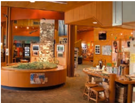
丹沢大山国定公園の自然を紹介する 県立秦野ビジターセンター