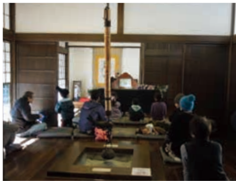
谷の家(里山体験施設)などでは多くの催しも開かれています