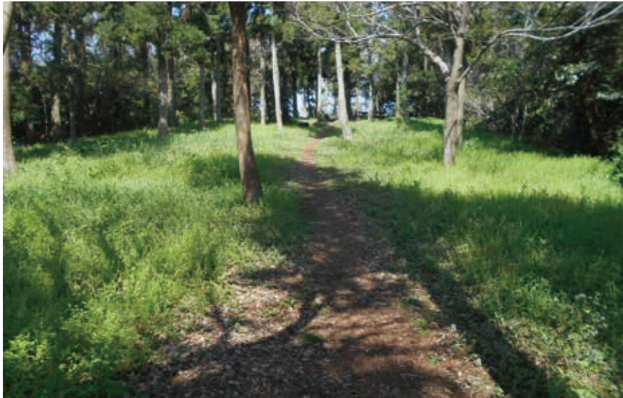
木漏れ日が降り注ぐ園路

葉山公園の約1km北に位置する緑地の保全を主な目的とした公園です。近郊緑地特別保全地区の公有地部分に最小限のふれあい施設を整備しました。園内には三路線のハイキングコースがあり、季節の草花や色々な昆虫、野鳥との出会いとともに素晴らしい眺望を楽しむことができます。