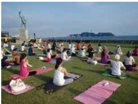
江の島を眺めながらのビーチヨガ