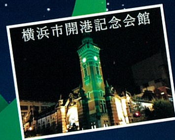
横浜市開港記念会館