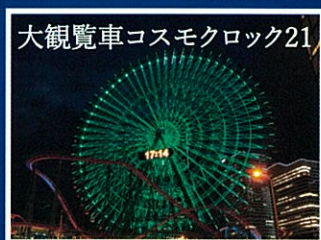
大観覧車コスモクロック21