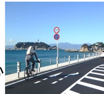
サイクルツーリズムイメージ