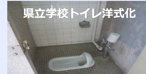
県立学校トイレ洋式化