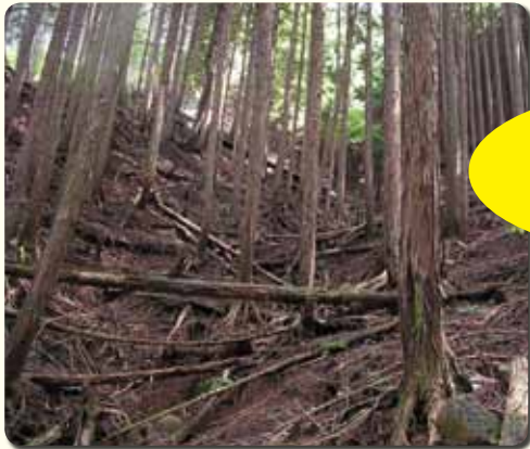
↑ 荒れた人工林 (暗くて草が生えておらず、土が流れてしまっている)

水源かん養機能(森林が土壌に雨水を蓄えることで、洪水を防止し、雨水の水質を浄化させること)の向上のため、枝打ち・間伐などの森林の整備を進めました。その結果、森林に光が入り、多種多様な草木が生い茂る、水源かん養機能の高い森林が復活しつつあります。