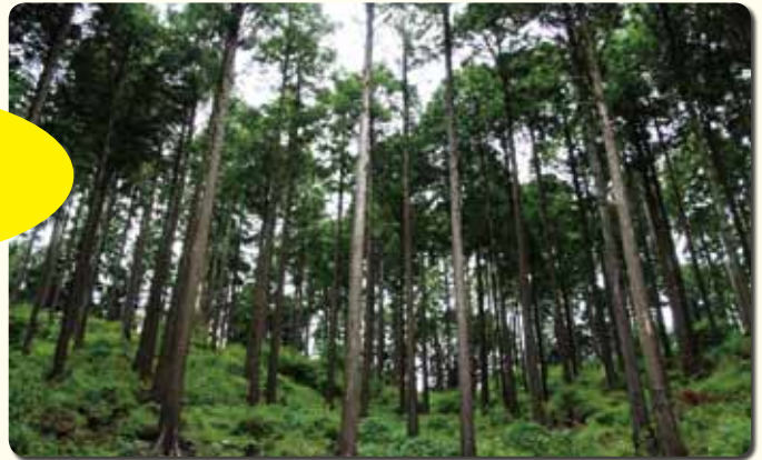
↑ 整備された人工林 (明るくなり、草木が生え、土をとどめている)