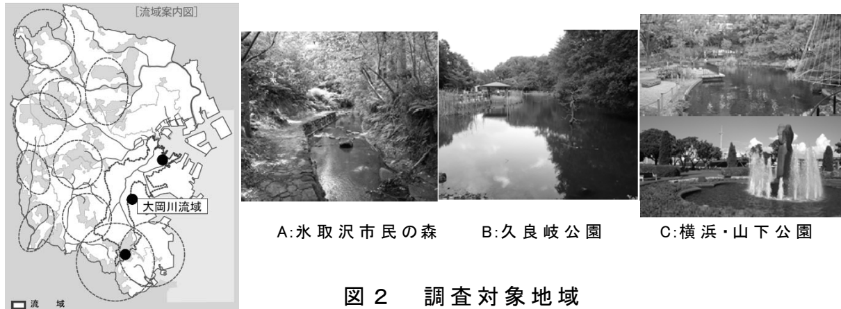
図 2 調査対象地域

調査項目は、植生、植物、哺乳類、鳥類、爬虫類、両生類、昆虫類である。調査は平成 24 年 6 月から 25 年 3 月に、各地域において、各項目 1～3 回の頻度で実施した。調査方法は、ルートセンサス、任意踏査を主とし、哺乳類・昆虫類調査では、トラップを用いた採集等を行わなかった。なお、平成 24 年 4～5 月に確認されたいくつかの種についても確認種数に含めた。